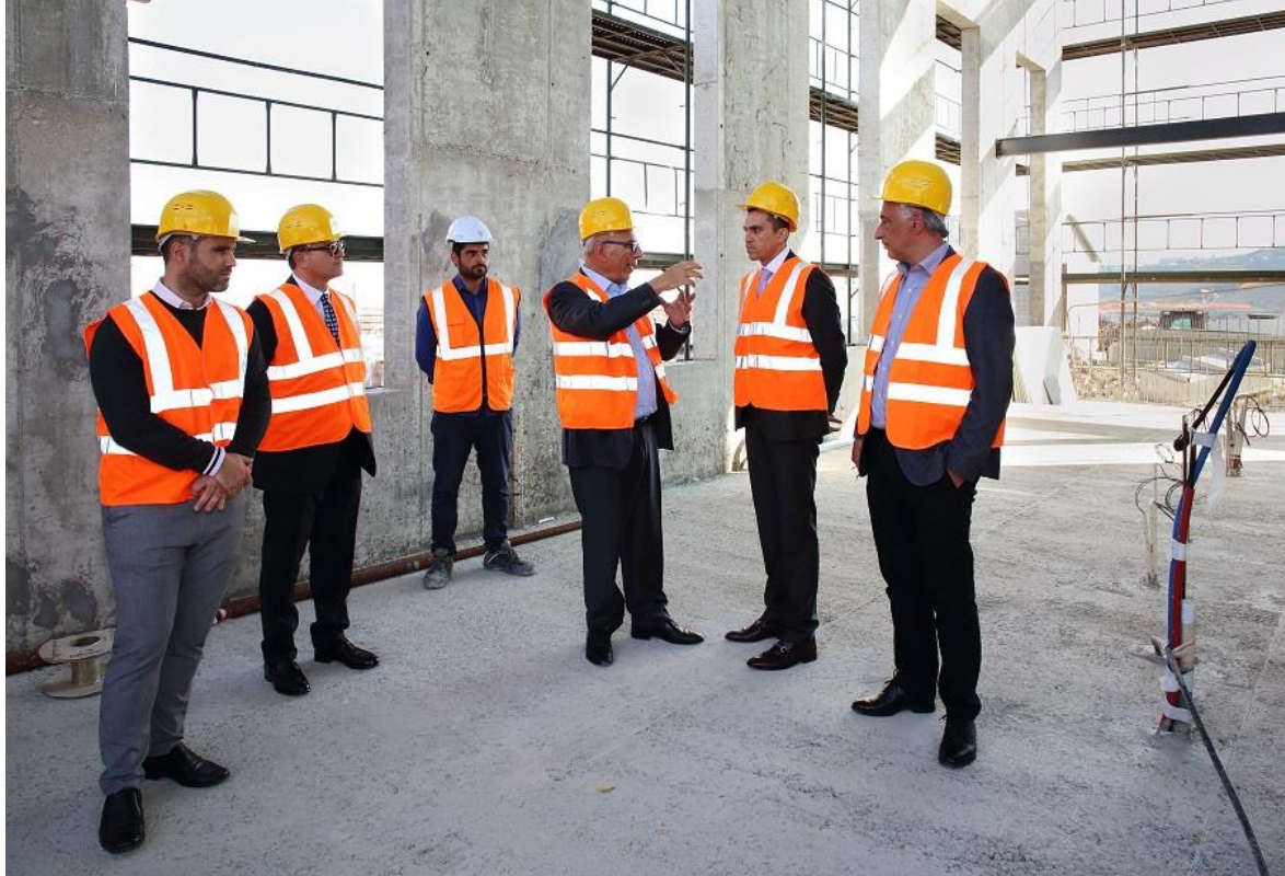
Ενημερώθηκε για την πρόοδο των εργασιών που αφορούν τις υποδομές και τις τουριστικές εγκαταστάσεις του θερέτρου